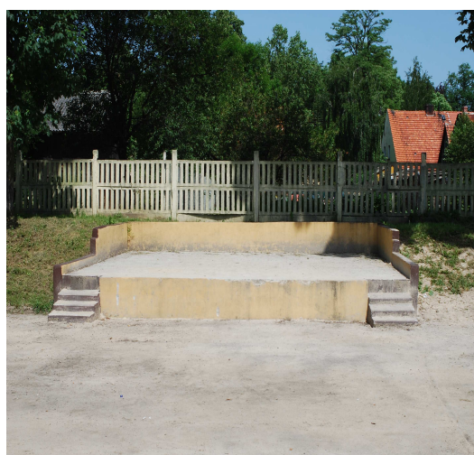
Fotografia : Boisko w legnickim Polu