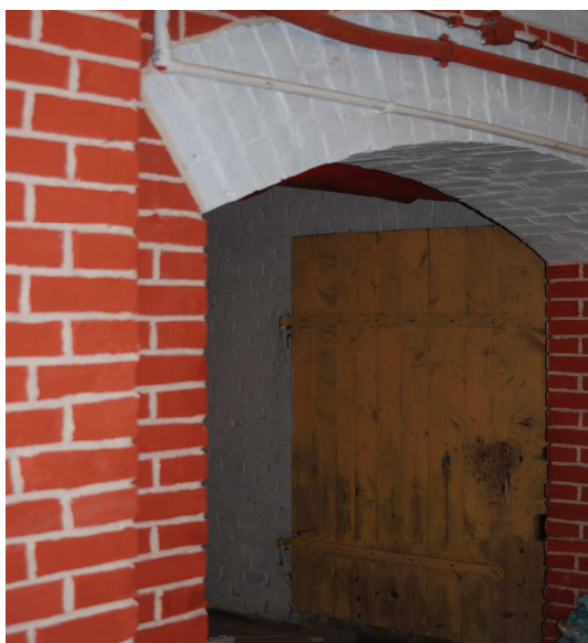
Fotografia: Legnickie Pole, ul. Benedyktynów 7