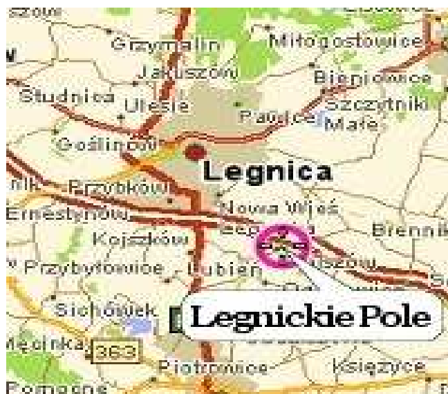
Rysunek 2. Lokalizacja miejscowości Legnickie Pole