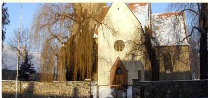
Rysunek 6. Muzeum Bitwy Legnickiej.