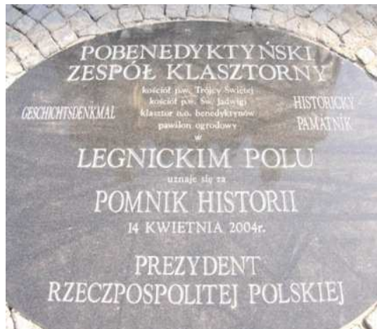
Rysunek 7. Tablica pamiątkowa przed wejściem do Kościoła pw. św. Jadwigi (1.10.2005r.)