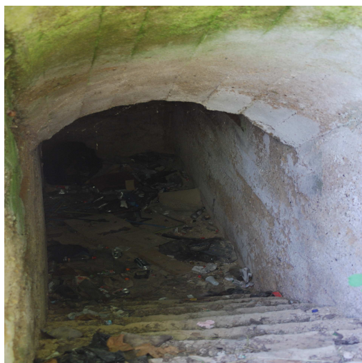
Fotografia: Schron w Legnickim Polu