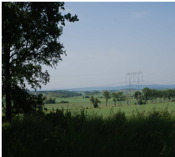
Fotografia: Legnickie Pole – punkt widokowy,