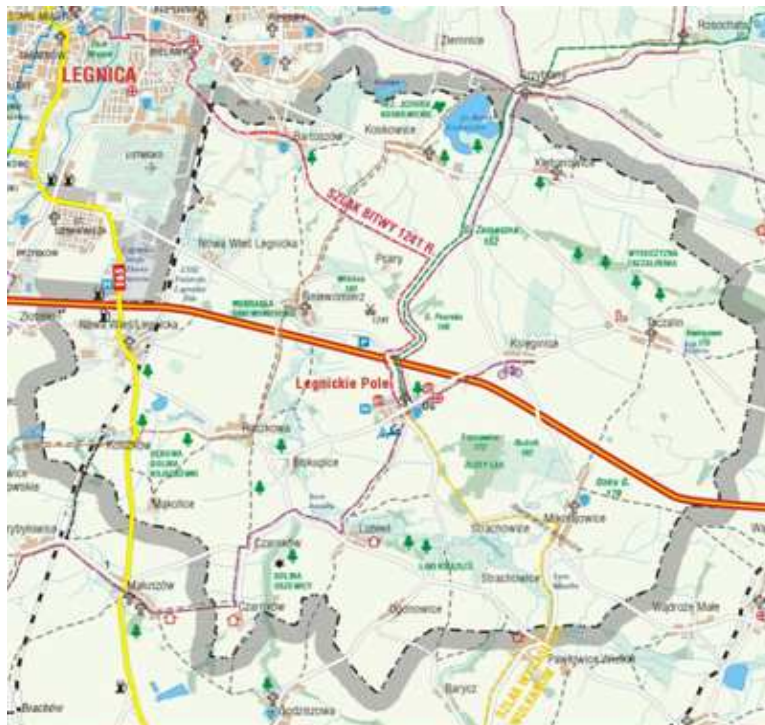
Rysunek 1. Mapa Gminy Legnickie Pole

Gmina Legnickie Pole jest Gminą wiejską o powierzchni 85 km 2 na Nizinie Śląsko - Łużyckiej w centralnej części województwa dolnośląskiego. Zgodnie z podziałem Polski i Śląska na jednostki fizjologiczne, obszar gminy położony jest głównie w zasięgu mezoregionu Wysoczyzny Chojnowskiej, północna część gminy należy do mezoregionu Równiny Legnickiej. Niemal cały obszar gminy charakteryzuje niskofalista i niskopagórkowata rzeźba terenu. Sąsiaduje z miastem Legnica oraz gminami: Krotoszyce, Kunice, Męcinka, Mściwojów, Ruja, Wądroże Wielkie.