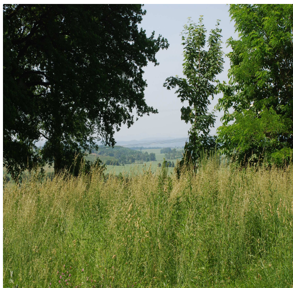
Fotografia: „lasek bakalski” - Legnickie Pole