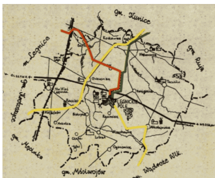
Rysunek 9. Szlaki turystyczne przechodzące przez Legnickie Pole.