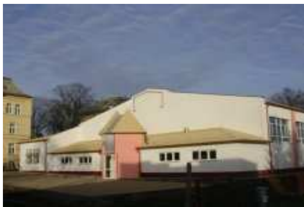
Rysunek 4. Sala gimnastyczna w Legnickim Polu