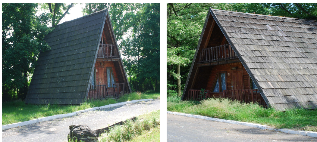
Fotografia: Legnickie Pole - domki letniskowe