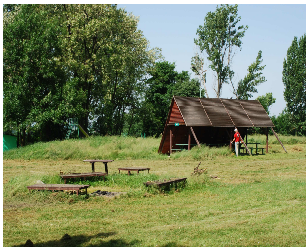
Fotografia: Legnickie Pole - teren rekreacyjny