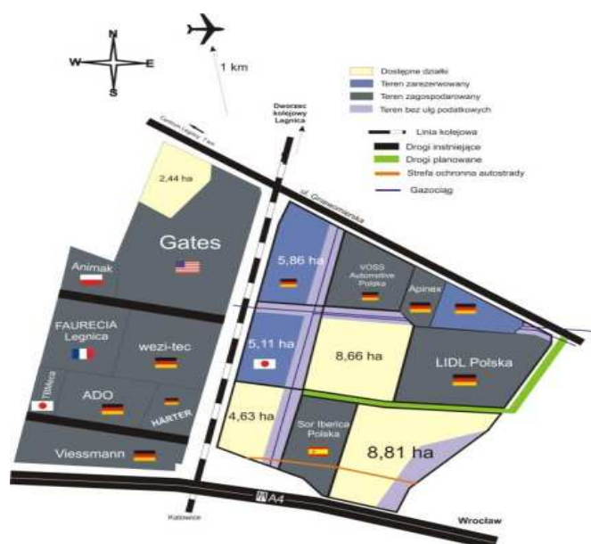
Rysunek 8. Podstrefa Legnickie Pole.