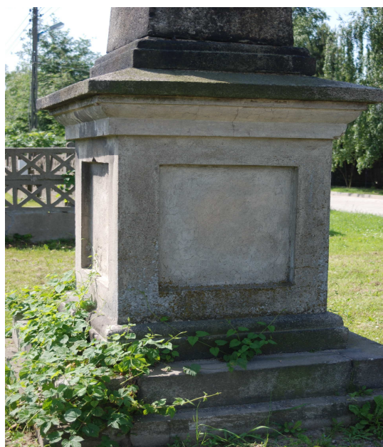
Fotografia: Krzyż przy ul. Janczarskiej