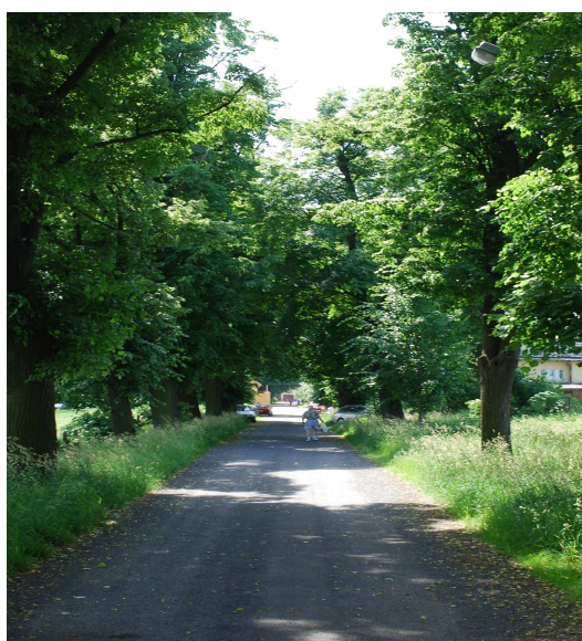
Fotografia: Legnickie Pole, ul. Księżnej Anny – Aleja lipowa