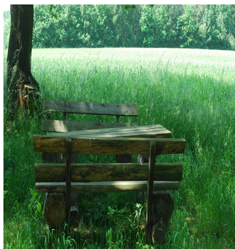
Fotografia: Złoty Szlak – Legnickie Pole