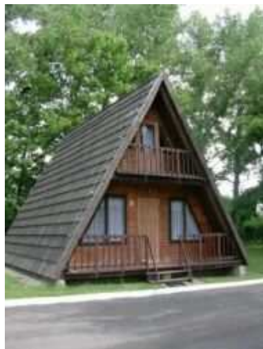
Rysunek 10. Camping w Legnickim Polu