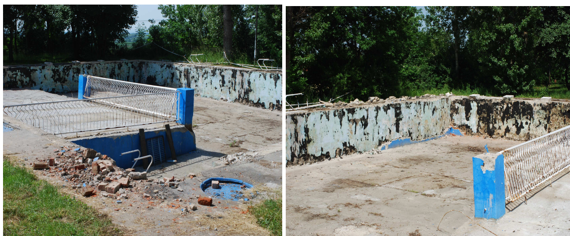
Fotografia: Legnickie Pole - niecka basenowa