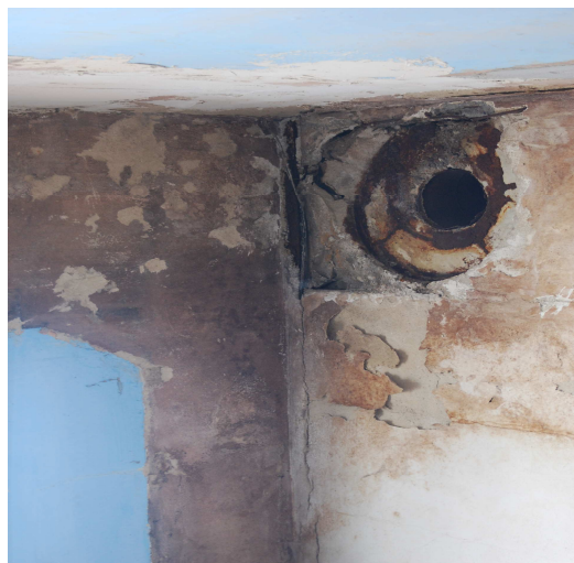
Fotografia: Legnickie Pole, Pl. Henryka Pobożnego 6-7, pomieszczenia z przeznaczeniem na utworzenie mediateki