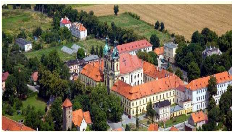
Rysunek 5. Kościół pw. Św. Jadwigi i zespół poklasztorny