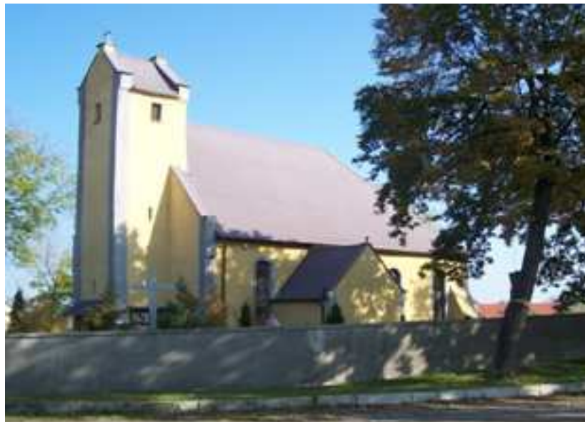
Rysunek 9 Kościół św. Bartłomieja