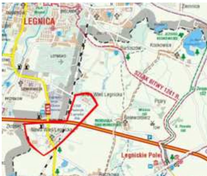
Rysunek 7 Lokalizacja miejscowości Nowa Wieś Legnicka