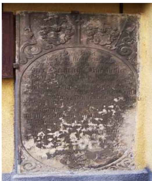
Rysunek 10 Epitafium przy kościele św. Bartłomieja