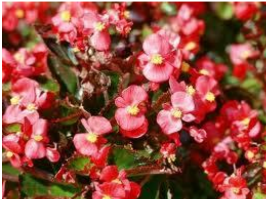
Begonia stale kwitnąca (czerwona)