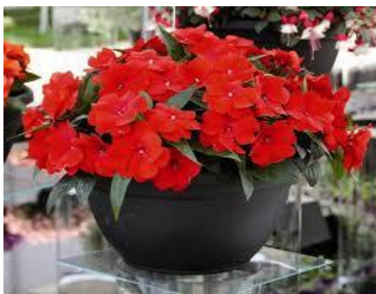
Niecierpek nowogwinejski (czerwony)