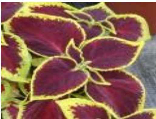
Koleus Blumego odmiana 'Scarlet'