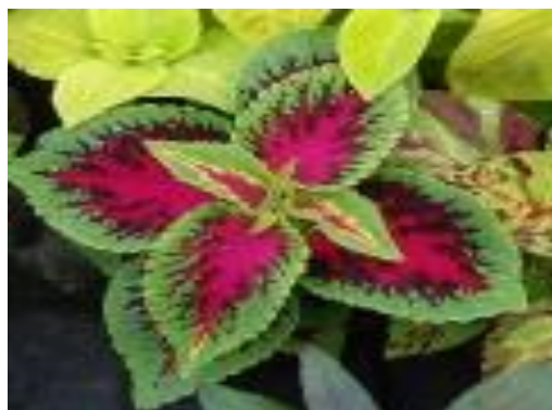
Koleus Blumego odmiana 'Rose'