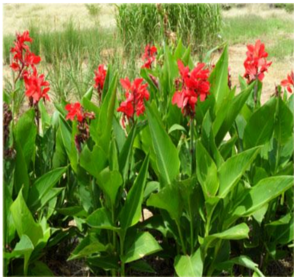
Paciorecznik ogrodowy (czerwony)