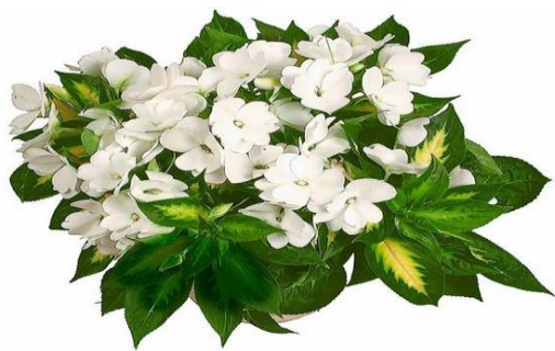
Niecierpek nowogwinejski (biały)