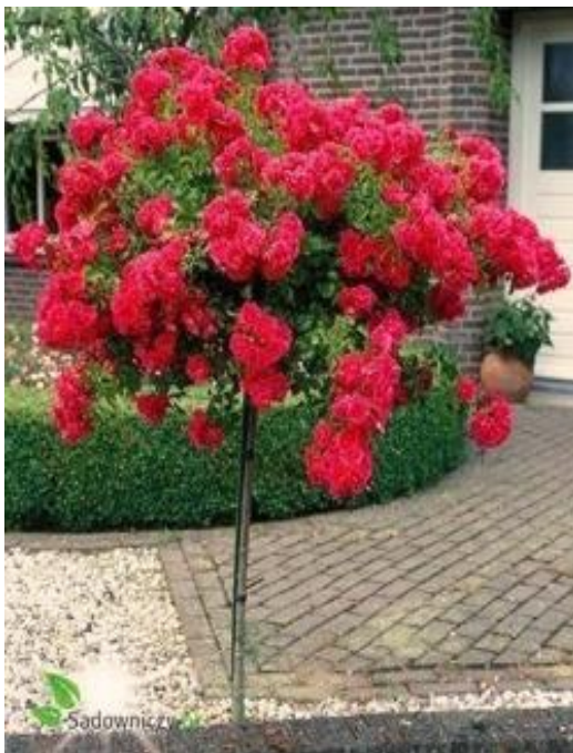
Róża pienna (czerwona)