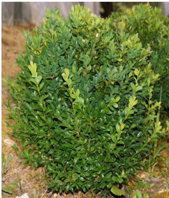
Bukszpan wieczniezielony (roślina na żywopłot)