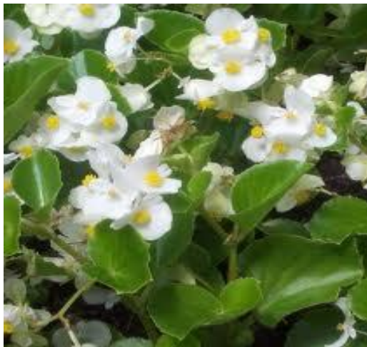
Begonia stale kwitnąca (biała)