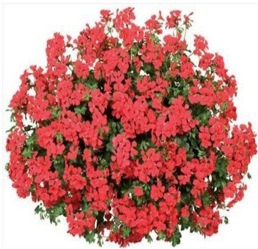
Pelargonia bluszczolistna (ciemno czerwony)