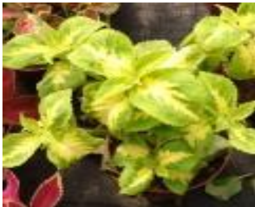
Koleus Blumego odmiana 'Green'/'Cream'