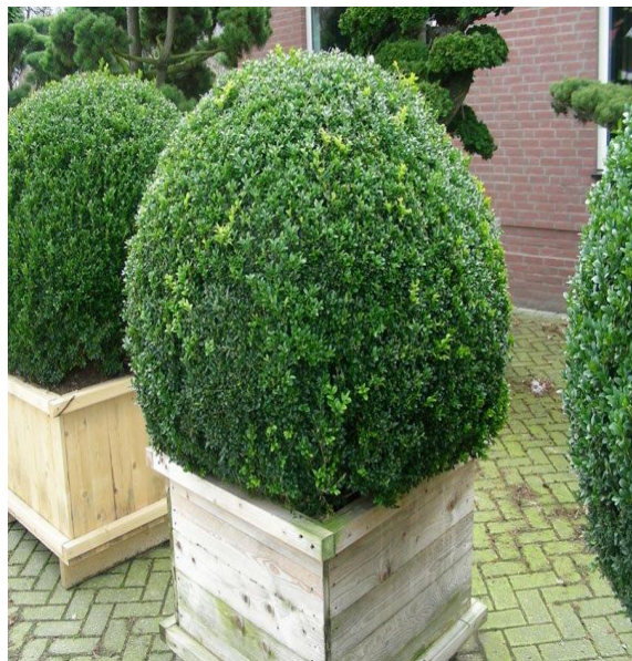
Bukszpan wieczniezielony (formowane kule do donic)